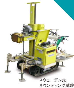
スウェーデン式サウンディング試験

スウェーデン式サウンディング試験(SWS試験)を標準とする。支持層が深い場合や、SWS試験では貫入が困難な場合には、動的コーン貫入試験(SRS)試験を用いる。