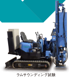
ラムサウンディング試験